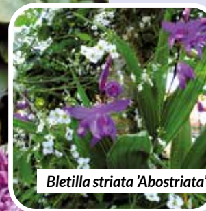
Bletilla striata 'Abostriata'

Bletilla striata 'Abostriata' . Zomers verblijden ze mij met talloze paarse bloemen op dunne stelen.'s Winters blijven deze orchideeën gewoon buiten. Bij meer dan -5° krijgen ze wel een 'dekontje'. De opgepotte exemplaren gaan naar binnen.