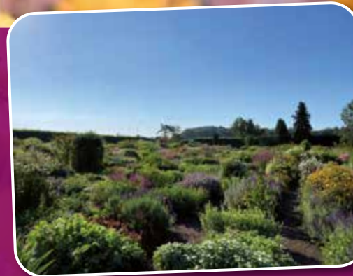
Kwekerij de Hessenhof