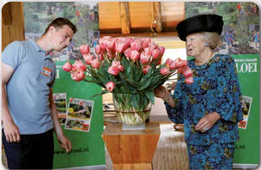
Beatrix samen met jongste verenigingslid Willem Poppe (20) en de nieuwe tulp

Samen met Willem Poppe (20), het jongste lid van de vereniging, doopte de prinses een nieuwe, oranje tuintulp: Tulipa 'Groei en Bloei 150' en nam de prinses een kijkje bij diverse presentaties op de openingsdag van het tuinfestival van de jubilerende vereniging.