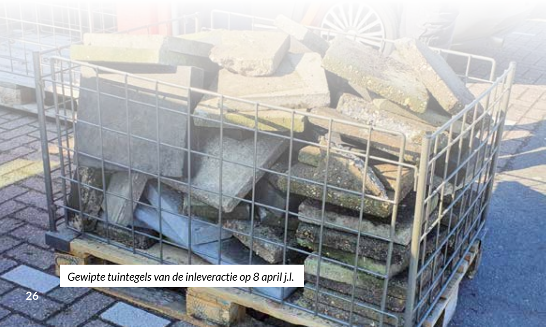
Gewipte tuintegels van de inleveractie op 8 april j.l.

Zaterdag 30 september biedt Groei&Bloei Noordoostpolder, in samenwerking met Intratuin en gemeente Noordoostpolder, dit jaar nog één keer de mogelijkheid om een gewipte tuintegel in te wisselen voor een gratis plantje.